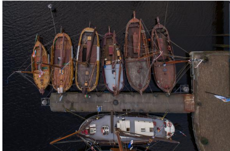
Het Skootje (helemaal links) samen met Wieringer en Lemmer Aken en Boppers tijdens de EOC-Traditionele Schepenbeurs in november 2017 in Den Helder.

Voor houten schepen is het een voordeel als ze een deel van het jaar op zout water liggen: het zeewater heeft een conserverende werking op het hout van de schepen.